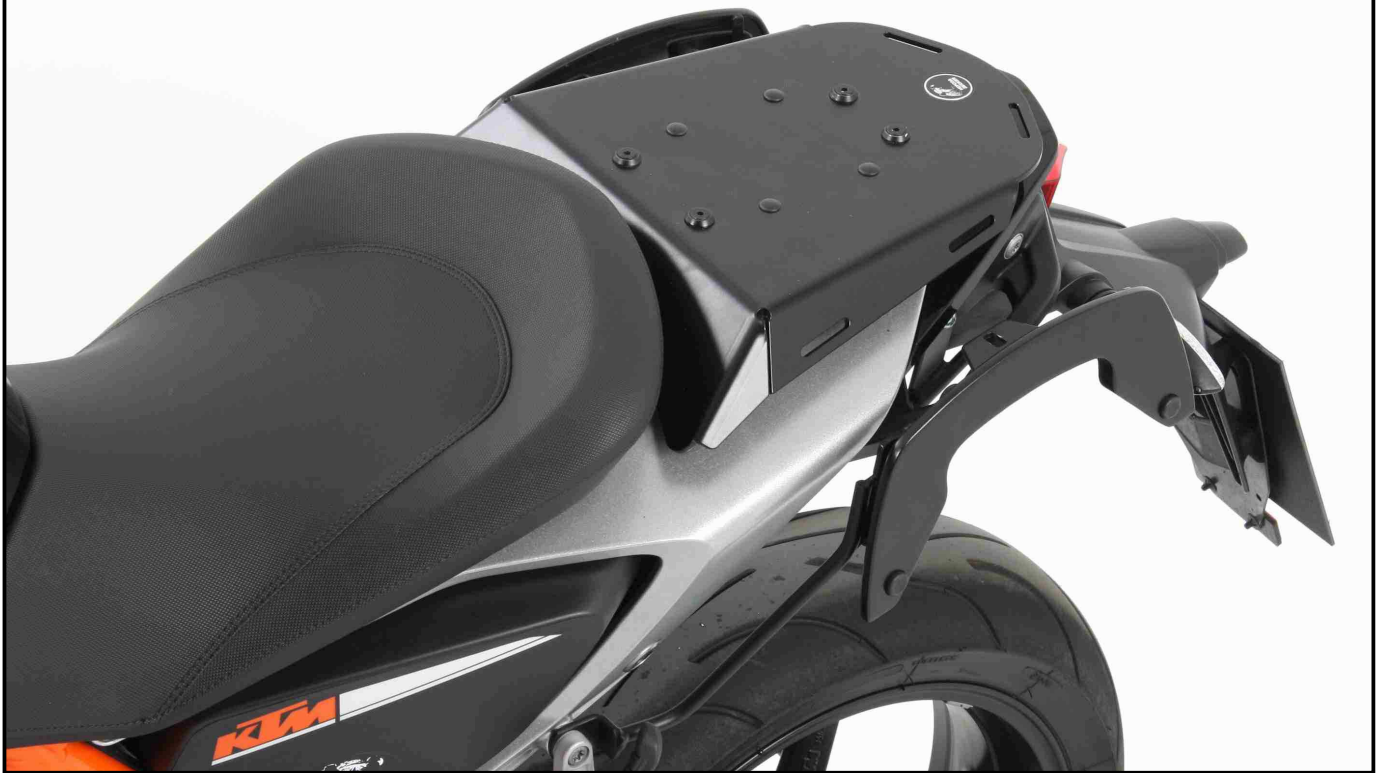
Bild zeigt als weiteres Zubehör den C-Bow Softtaschenhalter

Anzugsmomente des Motorradherstellers beachten! Nach der Montage alle Verschraubungen auf festen Sitz kontrollieren! Bitte beachten Sie unsere beigefügten Serviceinformationen.